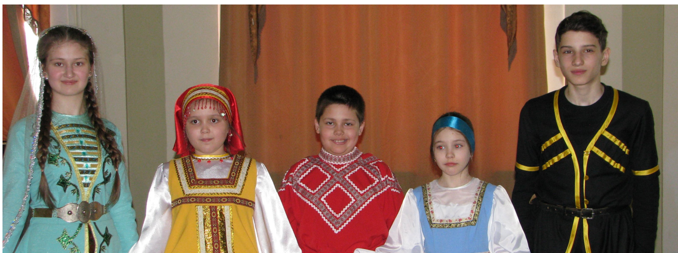
Победители II областного детского и молодежного фольклорно-этнографического конкурса «ЭТНОЛИК».