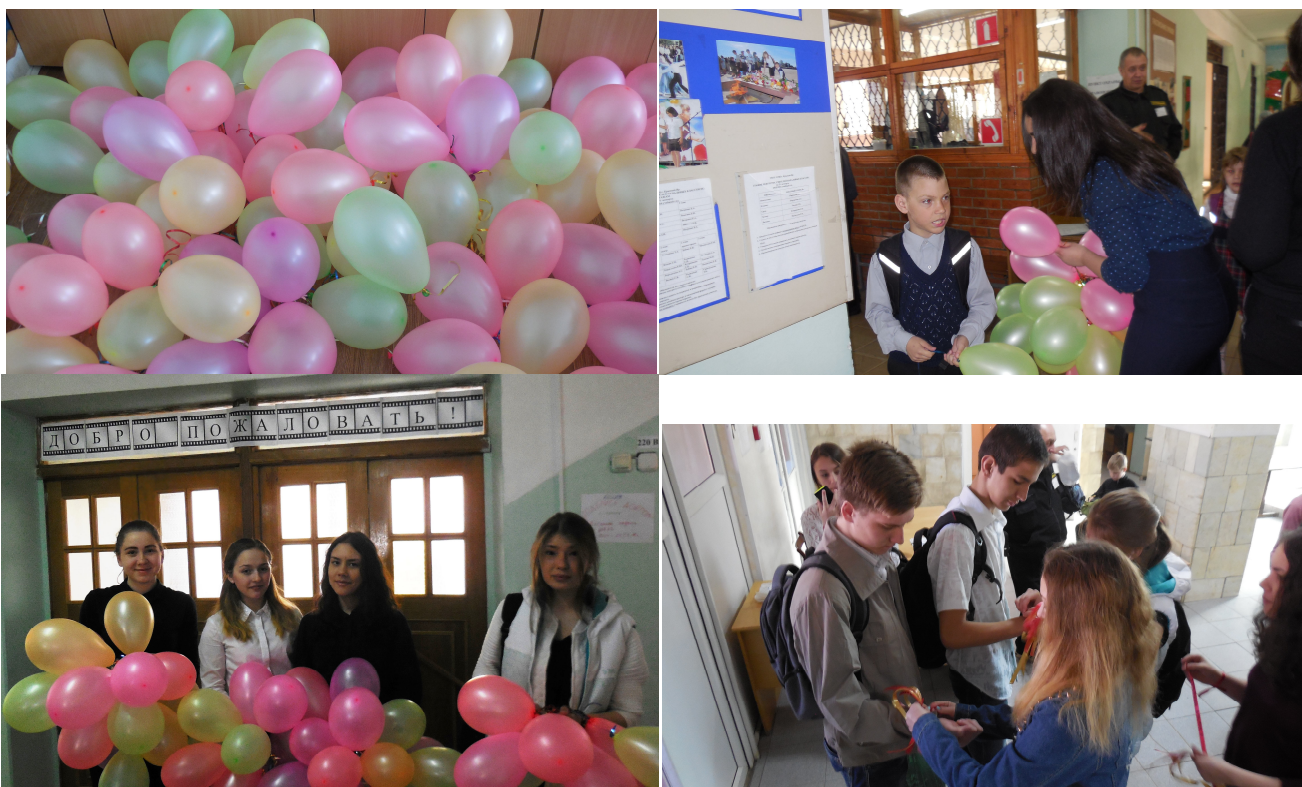
На фотографиях запечатлены разные мгновения старта «Весенней недели добра» в нашей школе.