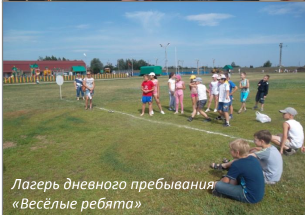
Лагерь дневного пребывания «Весёлые ребята»