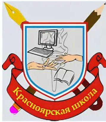
Герб ГБОУ СОШ с. Красный Яр

1867 год. Самарский уезд. На 1 июля. Во втором церковном округе открыто 13 ЦПШ, в которых обучается 249 мальчиков. Упоминается с. Дмитриевка. В 4 округе открыто 13 ЦПШ. Упоминаются 10 селений: Кобельма, Рус. Селитьба, Тростянка, Черновка, Неяловка, Хорошенькое, Раковка, Сырейка, Красный Яр , Новое Семейкино. (СЕВ, 1867, № 13, с. 392-393) Самарский уезд. На 15 июля. В 1 округе открыто 3 ЦПШ: Ивановка, Луговая Александровка, Урус-Александровка, В 3 округе открыто 2 ЦПШ: Дмитриевка и Чесноковка. (СЕВ, 1867, № 14, с. 377, 379)