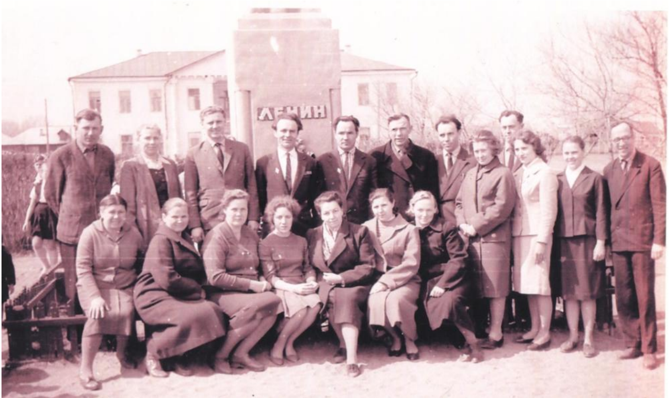
В 1965 около школы открыт обелиск воинам красноярцам погибшим на фронтах В.О.В.