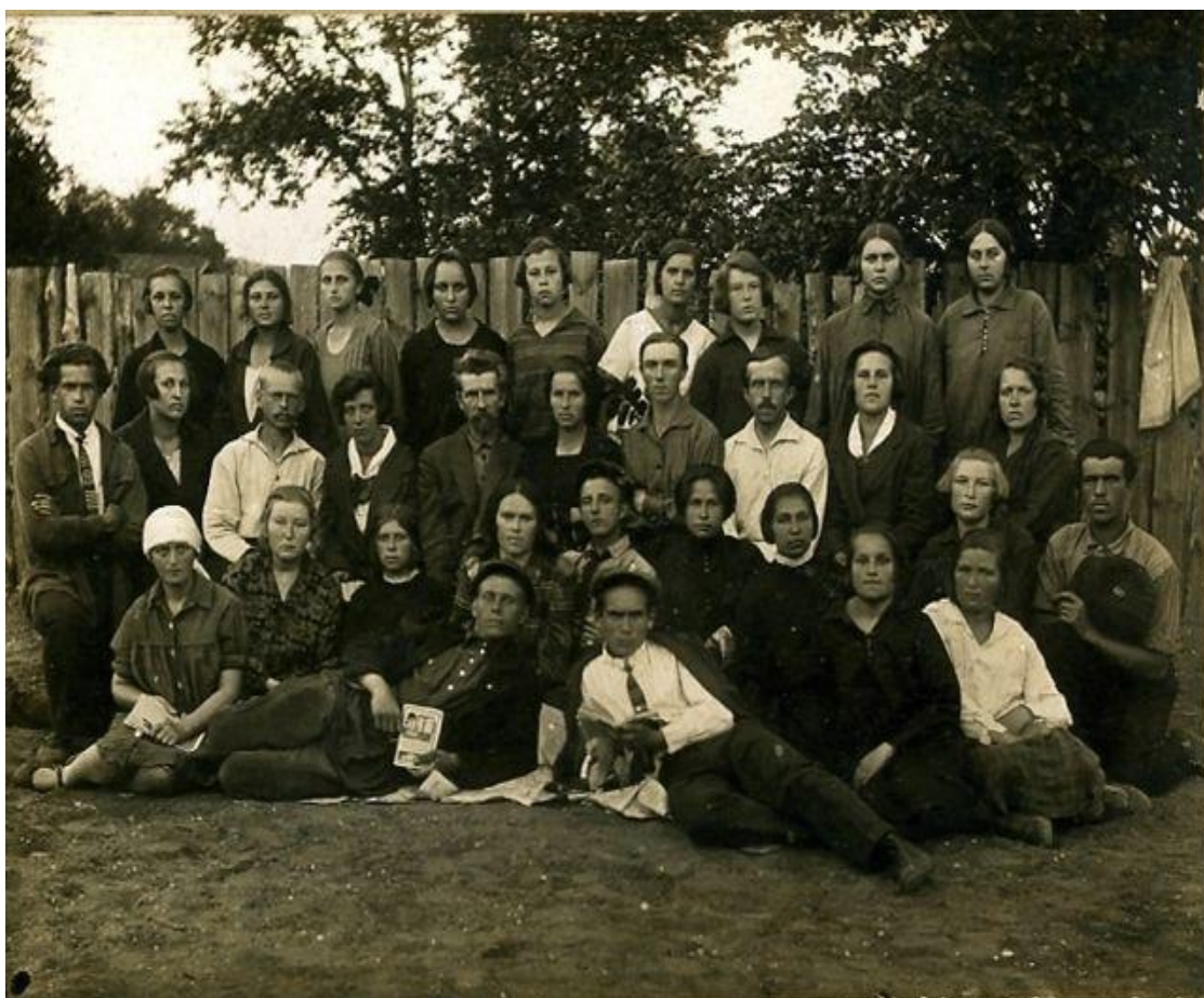
Педагогический коллектив Красноярской школы 1950гг