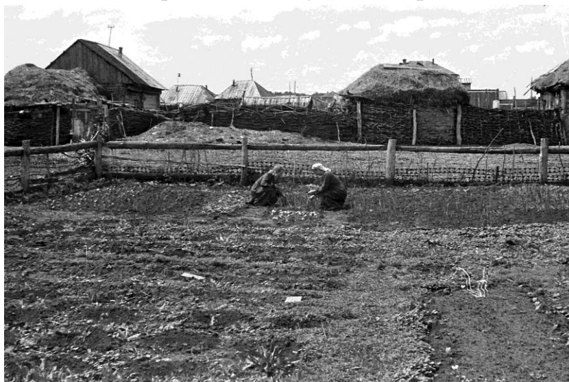
Работа на пришкольном участке ( фото1957 г)

Педагогический коллектив Красноярской школы в 1953 году состоял из 23 человек. Согласно книгам приказов по школе, сохранились следующие сведения о численности обучающихся: