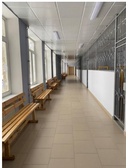
Здание начальной школы