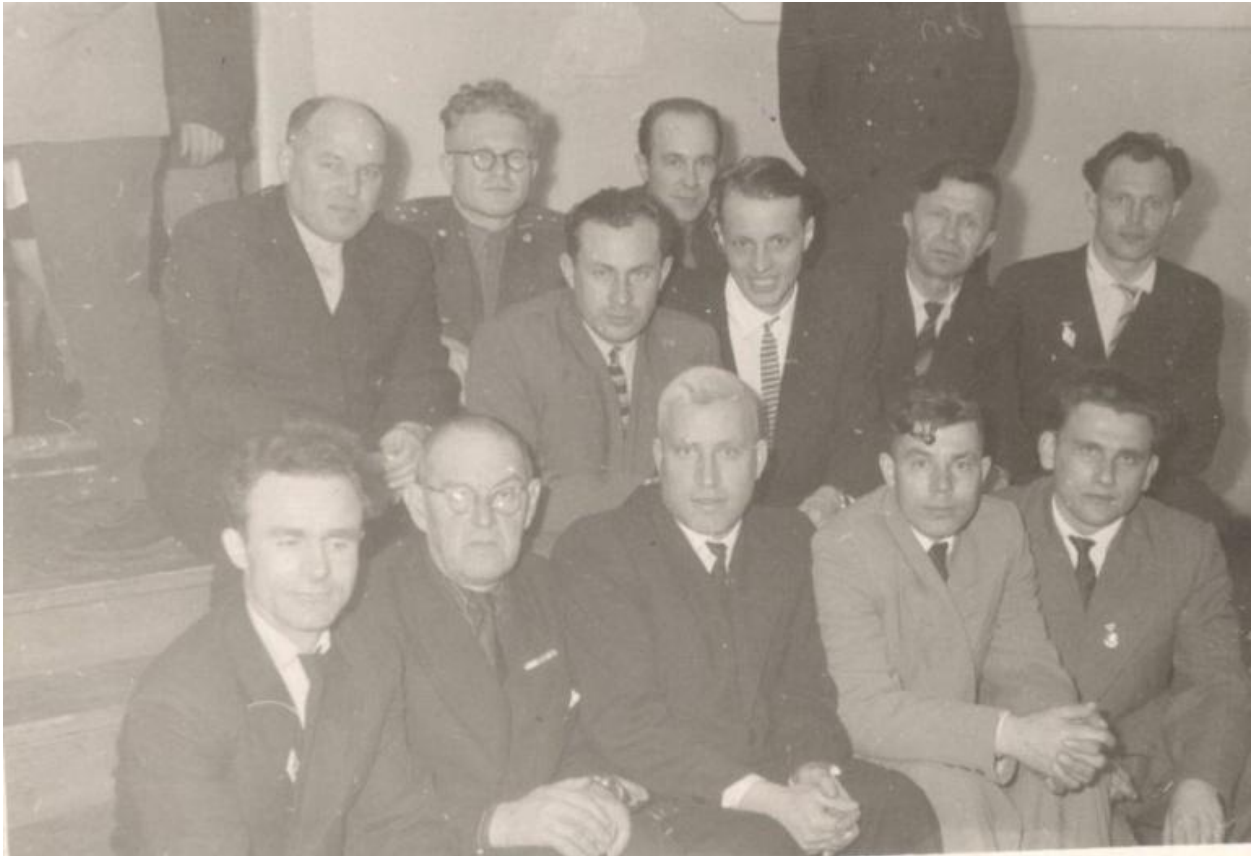
Коллектив учителей Красноярской школы 1965 года , около памятника В.И.Ленина