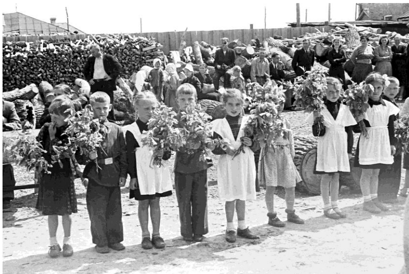
Учащие на фоне заготовленных дров ( фото 1956 г)