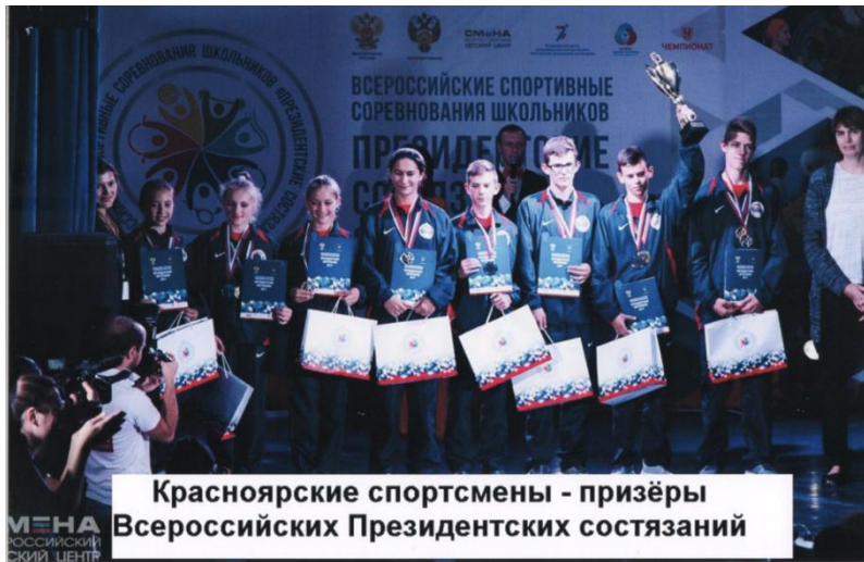
Красноярские спортсмены - призёры Всероссийских Президентских состязаний