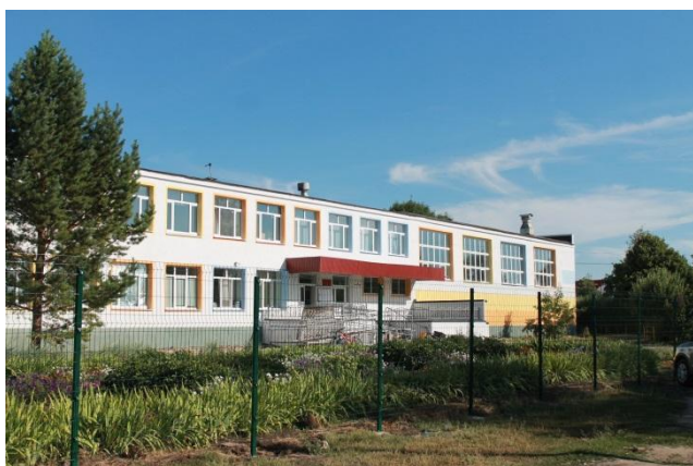
Здание начальной школы, главный вход