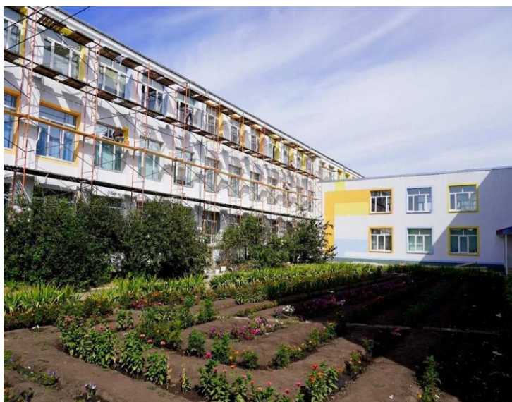
Здание средней школы, главный вход

Здание средней школы и переход Гардероб в средней школе