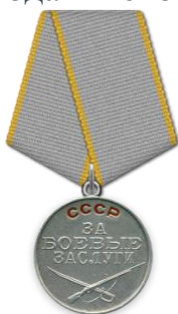
Медаль «За боевые заслуги» 19.05.1944