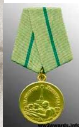
Медаль «За оборону Ленинграда»