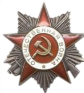
Орденом ВОВ II степени