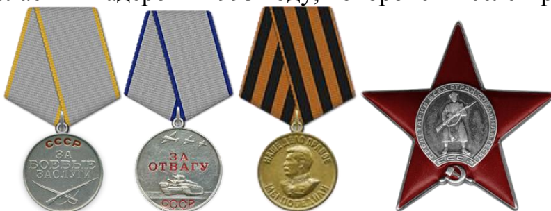
Медаль «За боевые заслуги» Медаль «За отвагу» Медаль «За победу над Германией в Великой Отечественной войне 1941–1945 гг.»