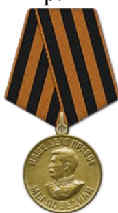
Медаль «За победу над Германией в 1941–1945 гг.» 09.05.1945