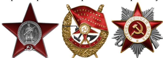
Орден Красной Звезды Орден Красного Знамени Орден Отечественной войны II степени

После войны вернулся на родину, работал главным бухгалтером в ОРС Красноярского леспромхоза. Умер 5 августа 1999 г.