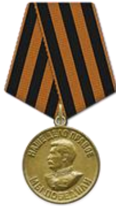
Медаль «За победу над Германией в ВОВ 1941–1945 гг.»

Служба продолжалась на границе с Румынией до 1950 года, откуда он вернулся в родные края. За победу в Великой Отечественной войне был награждён орденами, медалями различных степеней.