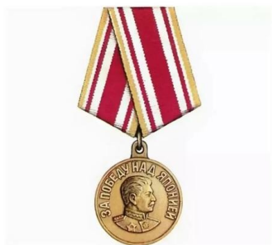
Медалью «За победу над Японией»