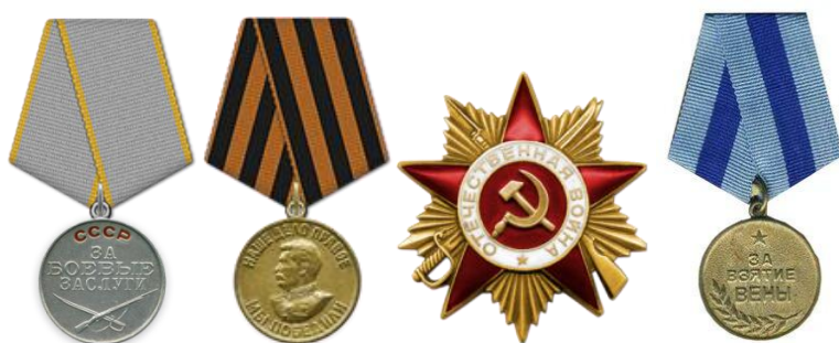
Медаль «За боевые заслуги» орденом Отечественной войны I степени медалью «За взятие Вены»,