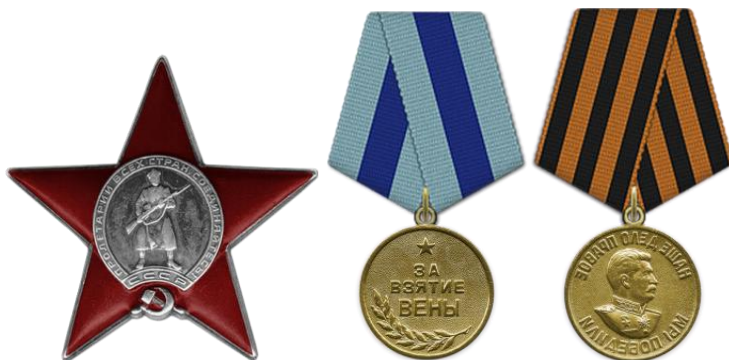
Орден Красной Звезды Медаль «За взятие Вены» Медаль «За победу над Германией в Великой Отечественной войне 1941–1945 гг.»