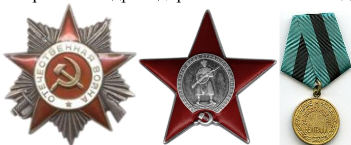
Орденом ВОВ II степени Орден «Красной Звезды» Медаль «За освобождение Белграда»