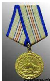
Медаль «За оборону Кавказа»

в Великой Отечественной войне 1941–1945 гг.»