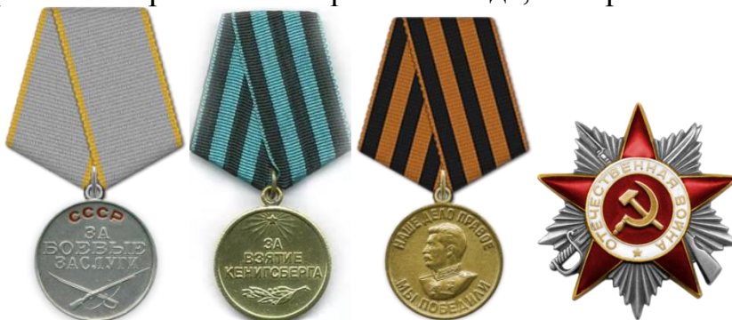
Медаль «За боевые заслуги» Медаль « За взятие Кенигсберга» Медаль «За победу над Германией в ВОВ 1941–1945 гг.» Орден Отечественной войны II степени