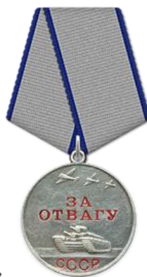
Медаль «За отвагу»