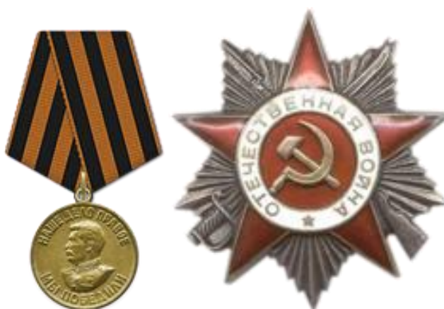
Медаль «За победу над Германией в ВОв 1941–1945 гг.»