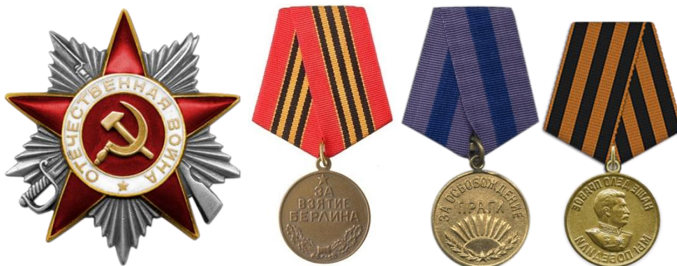
Орден Отечественной войны, II степени Берлина» Прагив ВО в 1941-1945 г.г.).