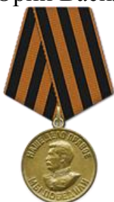
Медаль «За победу над Германией в ВОв 1941–1945 гг.»