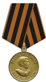
Медаль «За победу над Германией