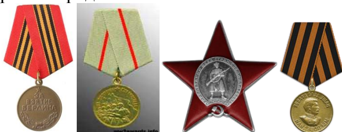
Медаль «За взятие над Берлина» Сталинграда»