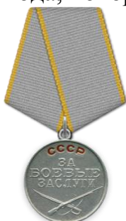
Медаль «За боевые заслуги» 19.05.1944