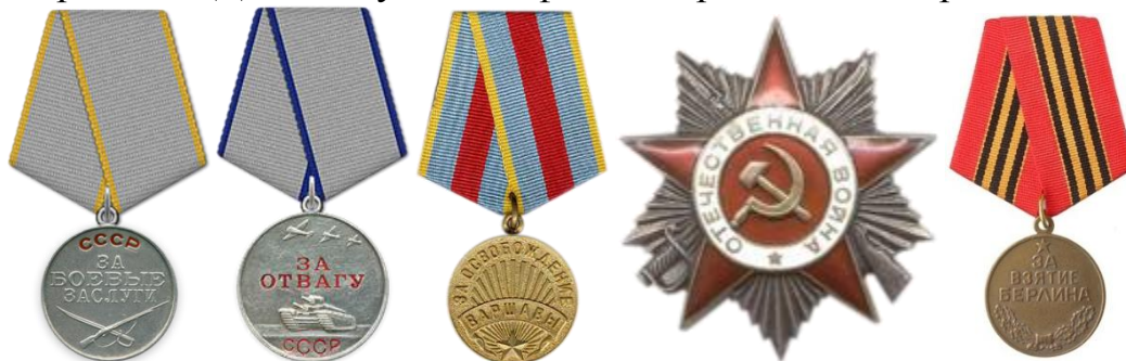
Медаль «За боевые заслуги» Медаль «За отвагу» Медаль «За освобождение Варшавы» Орденом Отечественной войны II степени Медаль «За взятие Берлина»