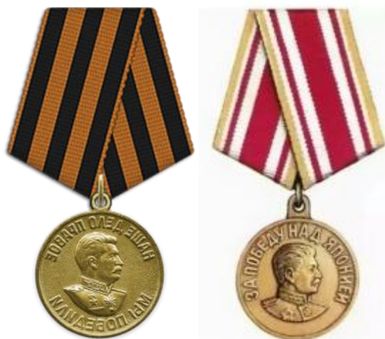
Медаль «За победу над Германией Орденем ВОВ II степени в Великой Отечественной войне 1941–1945 гг.»

Награды: орден Отечественной войны II степени, медаль «За взятие Берлина», медаль «За победу над Германией в Великой Отечественной войне 1941-1945 гг.».