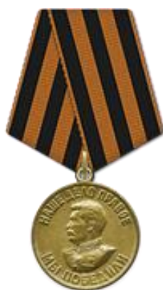
Медаль «За победу над Германией в ВОВ 1941–1945 гг.»