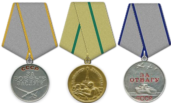
Медаль «За боевые заслуги»

Служил в воинской части 1 гвардейская танковая бригада , 207 самоходно-артиллерийская бригада, 123 танковый полк 123 танковой бригады