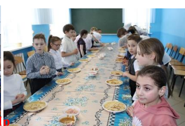
Масленичная неделя для учащихся ГБОУ СОШ с Красный Яр